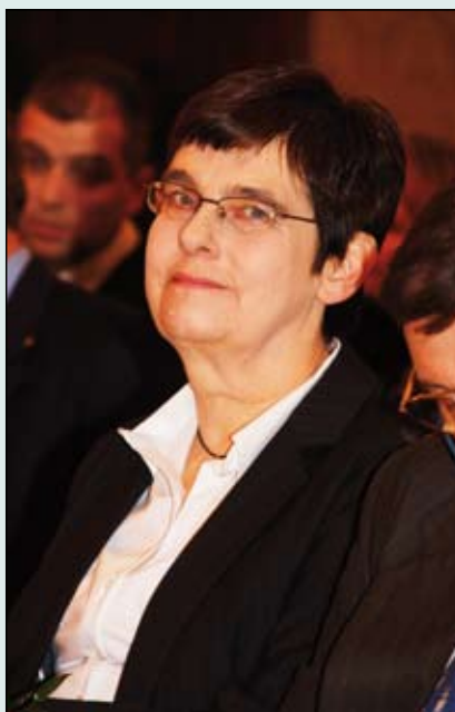
Od roku 1981 pracuje jako dětský dermatolog na dětském kožním oddělení ve Fakultní

V kurzech ČLK přednáším již tolik let, že si počátky naší spolupráce ani nepama-