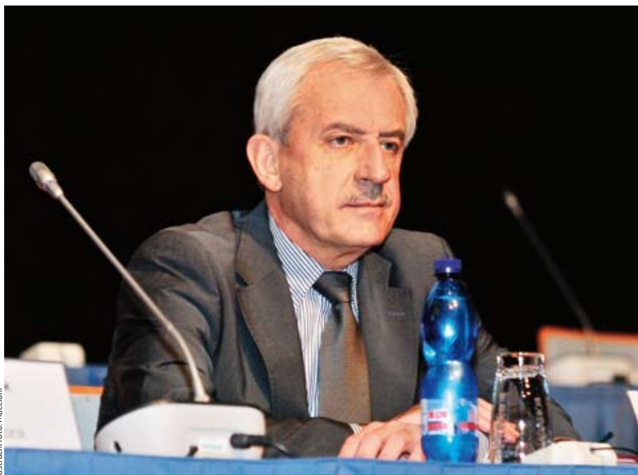
ilustrační foto: Macchiani